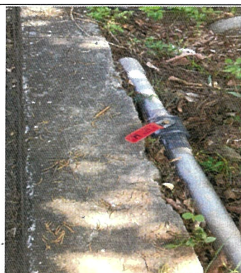
在入水處再新設控制閥