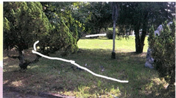
水管疑似破損示意圖