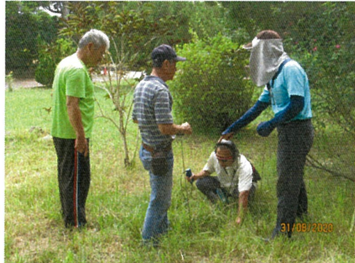
池上自來水廠派人查驗漏水處(二)