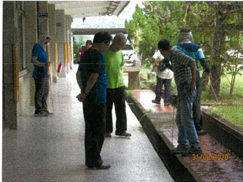
池上自來水廠派人查驗漏水處(一)