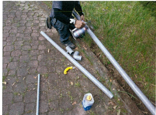
更換水管管過程(一)