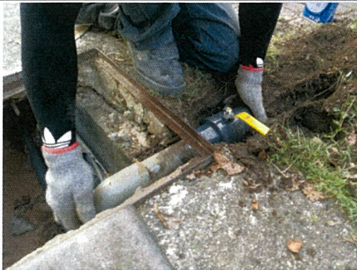
更換水管管過程(二)