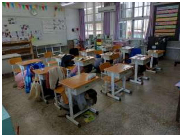
01 說明：教室內之趴掩穩避難