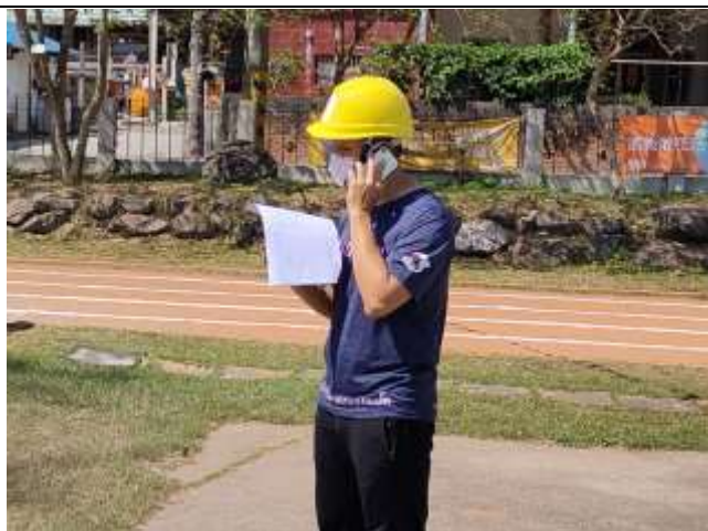
03 說明：各組間縱向橫向聯繫