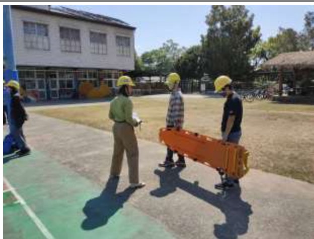
05 說明：校園搜救失蹤學生