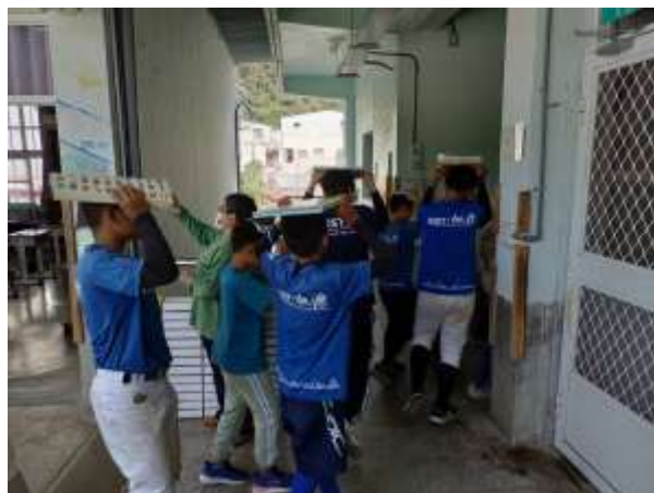
02 說明：地震稍歇戶外避難