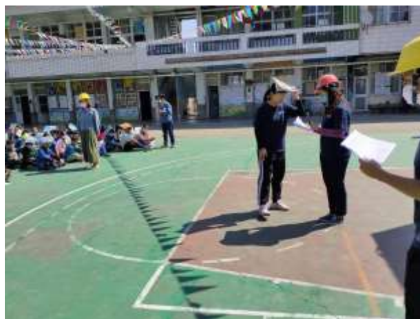
04 說明：各班級回報點名