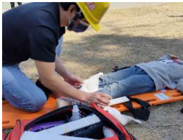
06 說明：受傷學生包紮